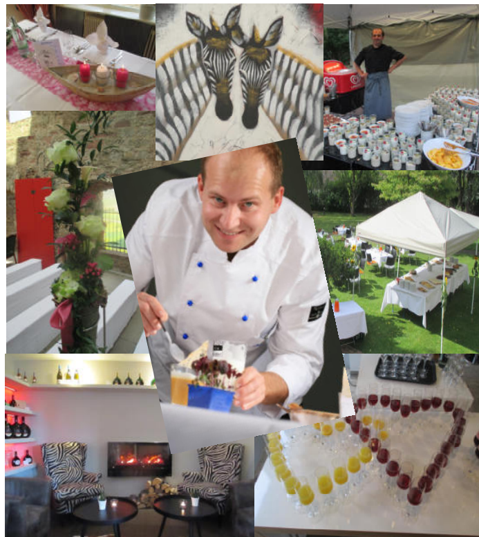
Stand: Mai 2019